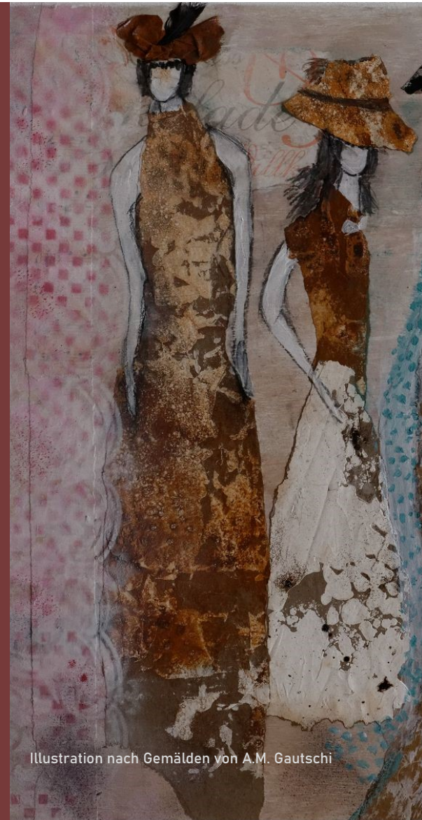
Illustration nach Gemälden von A.M. Gautschi